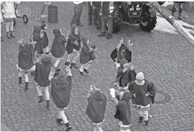
Trotz Regen hatten die Mädels großen Spaß beim Tanzen