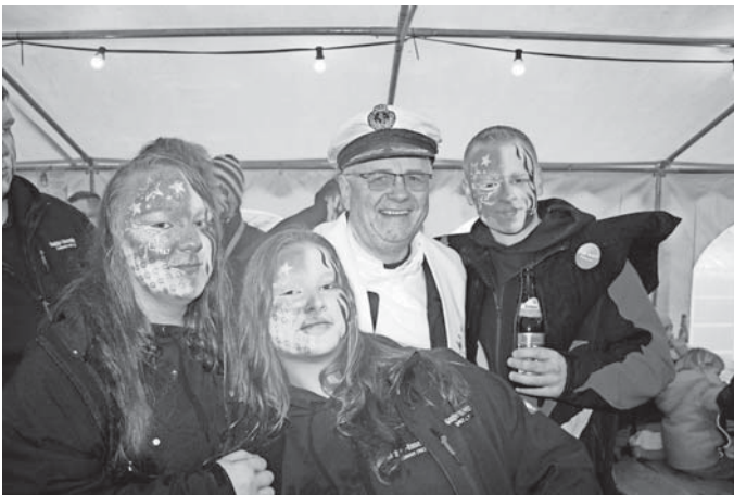
Pater Roman mitten unter seinen „Schäfchen“