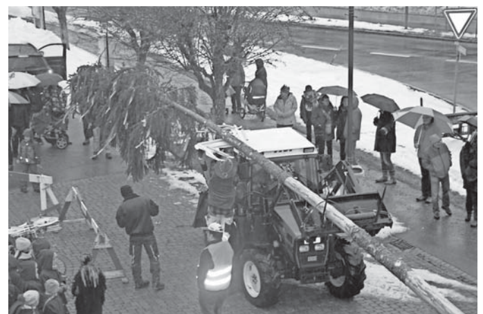
Aufstellung des Narrenbaums