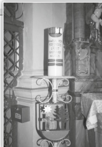
Jubiläumskerze am 25.11.2018

Mittwoch, 19. Dezember 2018 um 20:00 Uhr in der Wehratalhalle statt. Die entsprechenden Eigentümer haben bereits eine persönliche Einladung und alle Unterlagen zum Antrag und Hausanschlussvertrag zur Durchsicht erhalten.