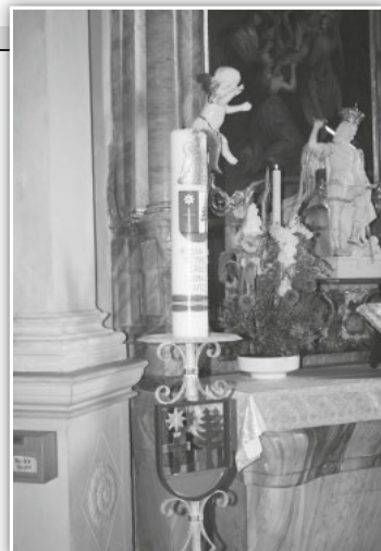
Jubiläumskerze am 19.08.2018