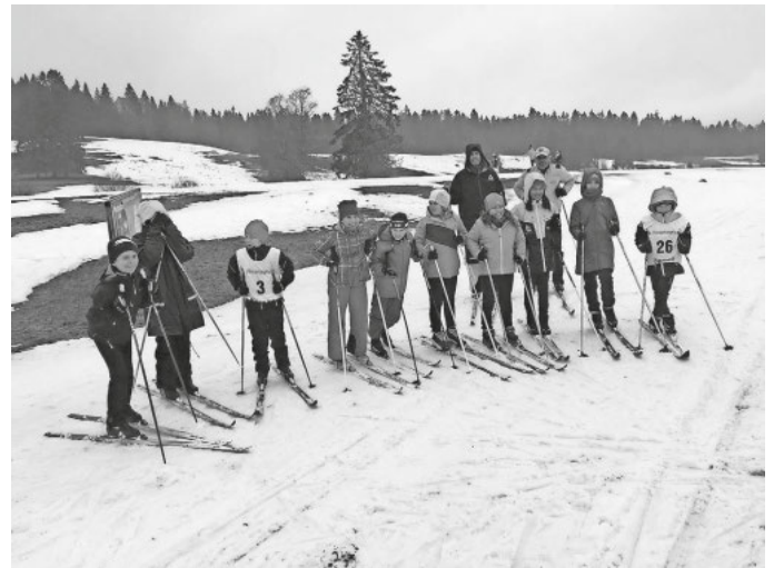
Meisterschaften in Bernau

Herzlichen Glückwunsch zu den tollen Leistungen und vielen Dank auch an die Helfer, die vor Ort waren!