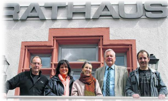
Projektgruppe Mobiles Todtmoos gestartet