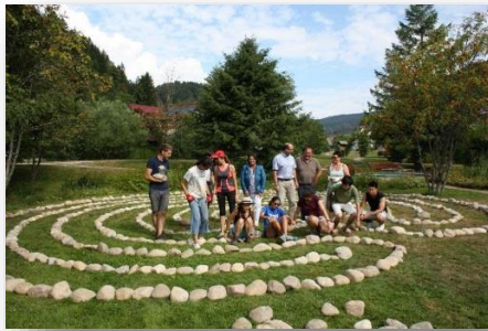
Verein Keltisch-Druidisches Erbe e. V. Todtmoos baut keltisches Steinlabyrinth im neuen Kurpark