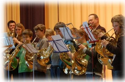
Hornwochenende mit Teilnehmern aus Deutschland, Schweiz, Norwegen und Frankreich