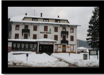
Kauf des Parkhotels durch die Gemeinde und Aufnahme ins Sanierungsgebiet