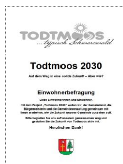
Strategieprojekt Todtmoos 2030 geht in die erste Runde