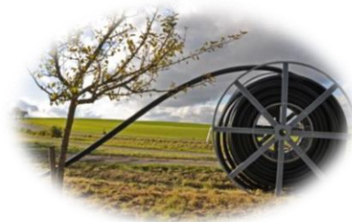
Zustimmung zur Gründung des Zweckverbandes Breitband im Landkreis Waldshut