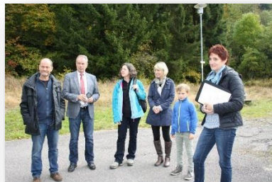
Verkehrsschau am 17.10.2016