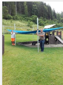
Der Kindergarten St. Elisabeth bekommt eine neue Nestschaukel und ein Sonnensegel