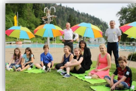
Neue Schirme im Freibad dank der Jugendsprechstunde