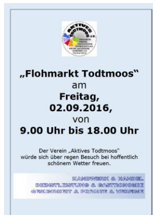
Aktives Todtmoos e.V. organisiert erneut einen Flohmarkt