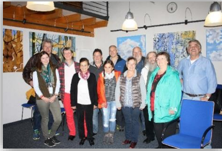
1. Treffen der Theatergruppe für die 750-Jahr-Feier