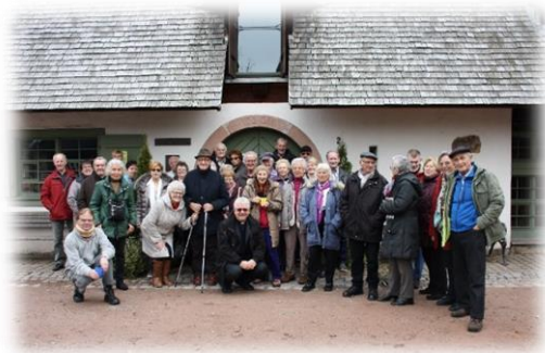
Kath. Kirche, Gemeindeverwaltung und unsere Senioren beim gemeinsamen Ausflug