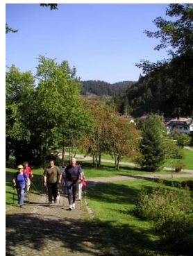
2. Gesundheitswoche von Aktives Todtmoos e.V.