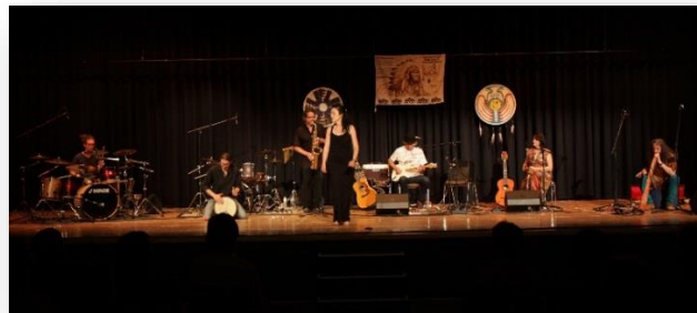
MACUA-Tomawho & Friends im Kurhaus Wehratal