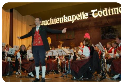
Osterkonzert mit der Trachtenkapelle Todtmoos