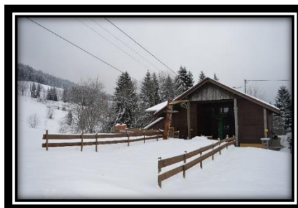
Sicherheitsanalyse für Hochkopflifte und Kirchberglift führt zu dem Entschluss die Lifte abzubauen