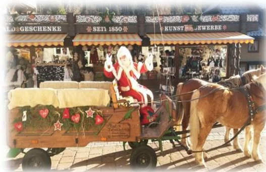
Der Nikolaus war am 6.12. im Ort unterwegs und besuchte auch die Kinder in der Schule und im Kindergarten