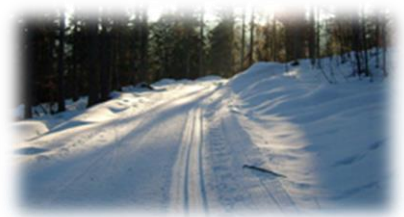
Vernetzung der Loipen und Winterwanderwege Todtmoos und Bernau