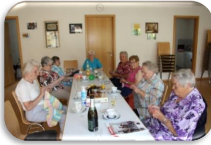
Die Strickfrauen stricken seit mehr als 30 Jahren für den guten Zweck