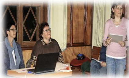
Der Helferkreis Flüchtlinge nimmt seine Tätigkeit auf