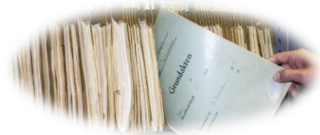
Todtmoos bleibt Grundbucheinsichtsstelle nach Auflösung des Grundbuchamtes