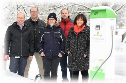
Ladestation für Elektrofahrzeuge wird aufgestellt