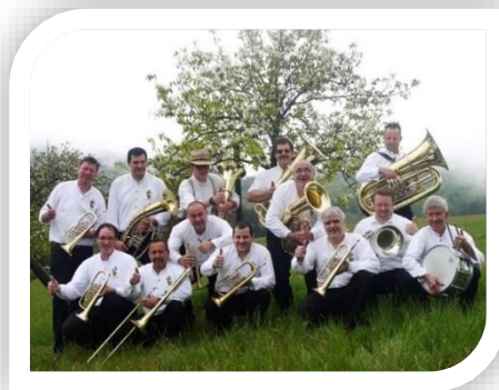
Konzert mit den neuen Blechmeisen