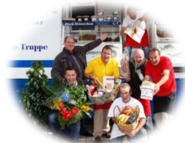
Hamburger Fischmarkt zum 8. Mal in Todtmoos