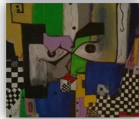
Petra Fritz stellt ihre Werke in Acryl aus