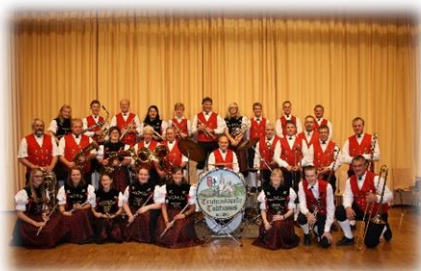
Sommerparty mit der Trachtenkapelle