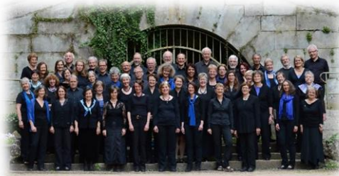
Englische Weihnachtsmusik mit dem Motettenchor