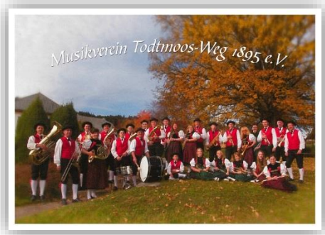
Jahreskonzert des Musikverein Todtmoos-Weg e.V.