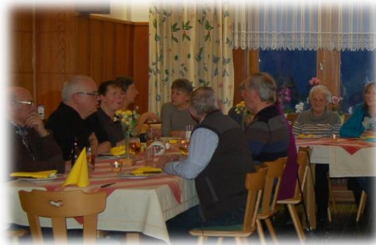
Neujahrsvesper für die Ehrenamtlichen