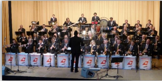
Swiss Band live @ todtmoos