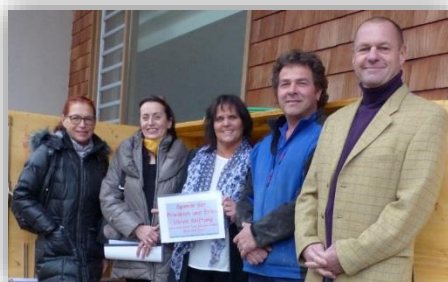
Der Todtmooser Grundschule werden 1.300 € gestiftet