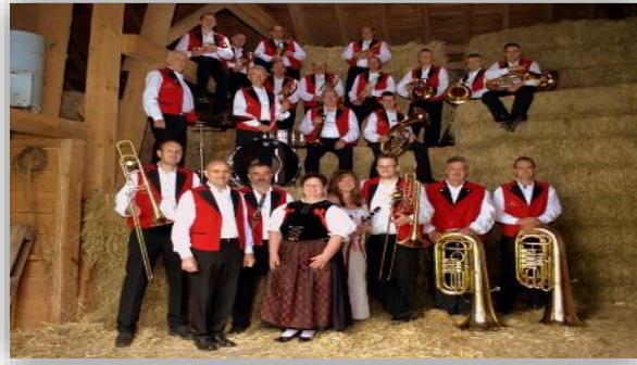
Konzert mit den fidelen Dorfmusikanten