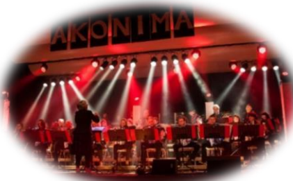
Jahreskonzert des Akkordeon-Orchesters Todtmoos Akonima