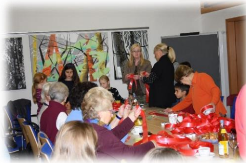
Miteinander der Generationen bei der Aktion "Weihnachtsbäume schmücken"