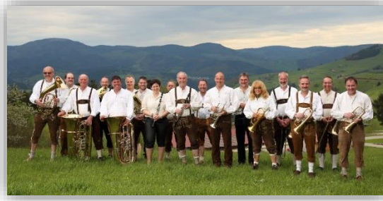
2Konzert mit der „Bloskapelle Mengmol“