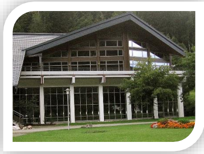
Neue Preis für die Anmietung der Wehratalhalle