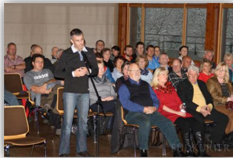
Bürgerversammlung zum Thema Skilifte