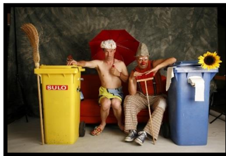
Kakerlaki Clowntheater sorgt für Spaß