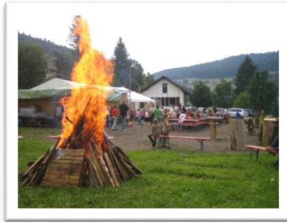
Lagerfeuer des Musikvereins Todtmoos-Weg