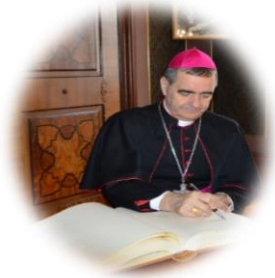
Erzbischof Nikola Eterovic zu Besuch als offizieller Bote des Papstes