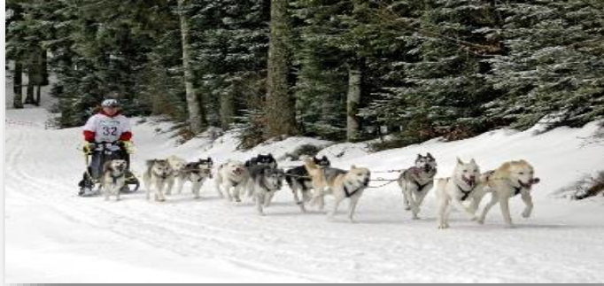
Qualifikation für die IFSS Europameisterschaften und für den SHC Club Champion beim Internationalen Schlittenhunderennen