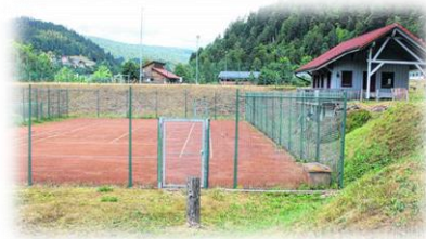
Bebauungsplanänderung Teilbebauungsplan "Jägermatt II". Aus dem Tennisplatz wird ein Wohnmobilstellplatz