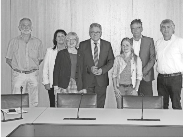
Treffen mit Minister Guido Wolf